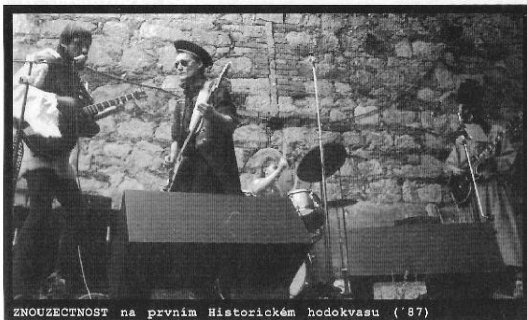
ZNOUZECTNOST na prvním Historickém hodokvasu ('87)